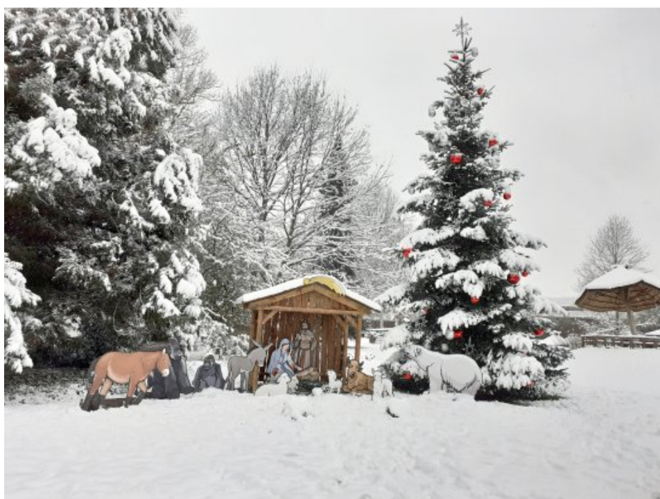
Krásná vánoční atmosféra u betléma v ZOO Praha s koněm Převalským, ledním medvědem a gorilou. Sníh přidala příroda začátkem prosince.