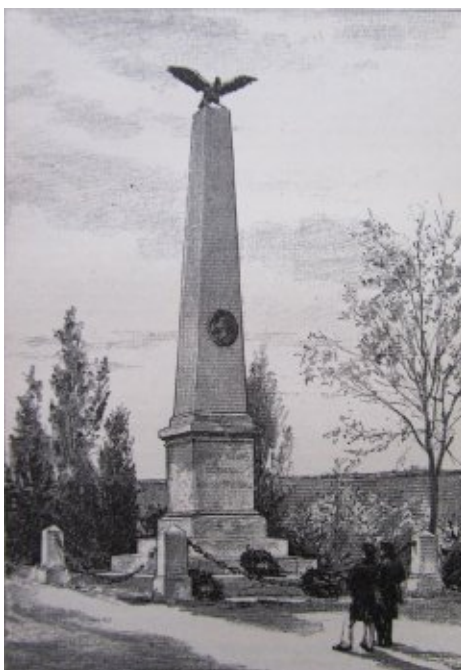
Původní vzhled pomníku

10. května 1869 byly do připraveného hrobu přeneseny ostatky J. Fügnera a po postavení náhrobní stély koncem června byl 18. července po-