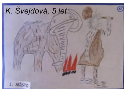
K. Švejdvová, 5 let

Všechnu práci od vyhlášení soutěže, shromáždění výkresů, vystavení výkresů a vyhlášení nejlepších při-